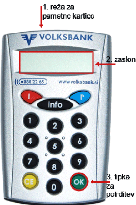
italec Digipass 810

Ob vsakokratnem generiranju enkratnega gesla kartica od vas zahteva vnos vaze osebne ztevilke PIN. Na ta način in je zagotovljeno, da lahko enkratno geslo uporabi samo lastnik kartice.